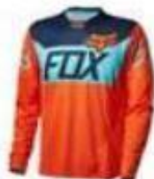
MAILLOT MANCHES LONGUES